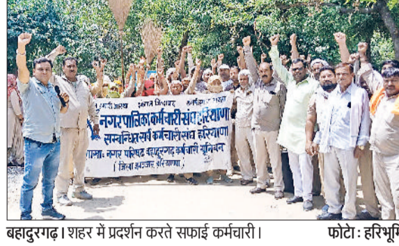
बहादुरगढ़। शहर में प्रदर्शन करते सफाई कर्मचारी।