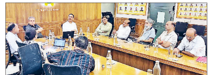
बहादुरगढ़। बैठक में चर्चा करते कोबी पदाधिकारी व सदस्य।

कॉन्फेडरेशन ऑफ बहादुरगढ़ इंडस्ट्रीज की बैठक में वायु गुणवत्ता प्रबंधन आयोग द्वारा औद्योगिक इकाइयों पर की जाने वाली निरीक्षण प्रक्रिया एवं तत्काल क्लोजर नोटिस जारी करने की कार्रवाई पर विस्तार से चर्चा की गई। उद्यमियों के अनुसार सीएव्यूएम का निरीक्षण पर्यावरण संरक्षण के दृष्टिकोण से आवश्यक है। परंतु आवश्यक कंसेंट एवं अनुमति के साथ आवश्यक मरम्मत कार्य के दौरान भी सीएव्यूएम बिना वास्तविक परिस्थिति को समझे और बिना सुधार का अवसर दिए सीधे तत्काल क्लोजर नोटिस जारी कर देता