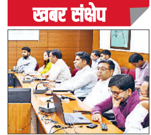
झज्जर। बैठक के दौरान आवश्यक दिशा निर्देश देते हुए अधिकारी।