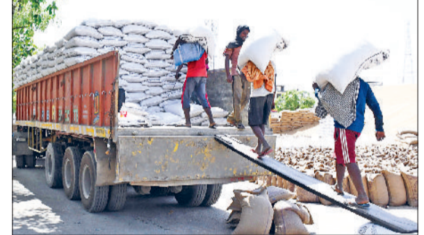
झज्जर। अनाज मंडी परिसर में उठान कार्य में जुटे श्रमिक।