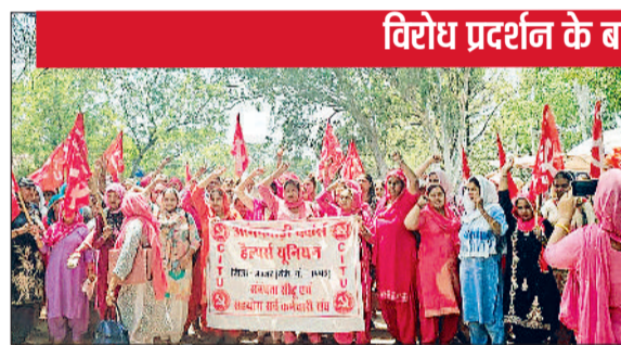
झज्जर। विरोध प्रदर्शन करते हुए आंगनबाड़ी वर्कर्स एवं हेल्पर, प्रशासनिक अधिकारी को ज्ञापन सौंपते हुए आंगनबाड़ी वर्कर्स एवं हेल्पर।

शुक्रवार को आंगनबाड़ी कर्मचारियों ने लंबित मांगों को लेकर लघु सचिवालय में विरोध प्रदर्शन किया। आंगनबाड़ी वर्कर्स एवं हेल्पर लघु सचिवालय के बाहर ग्रीन बेल्ट में एकत्रित हुईं। यहां धरना देने के बाद वे जुलूस की शक्ति में नारे बाजी करते हुए लघु सचिवालय पहुंचीं। जहां