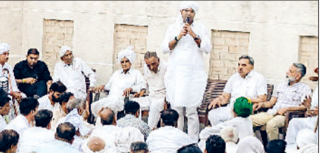
झज्जर। कार्यकर्ताओं को संबोधित करते हुए पूर्व डिप्टी सीएम दुष्यंत सिंह चौटाला।

हरियाणा के पूर्व उपमुख्यमंत्री दुष्यंत चौटाला ने कहा कि छात्र हितों के लिए प्रदेशभर के युवाओं एवं सामाजिक लोगों की एक महापंचायत हिसार में होगी। उन्होंने कहा कि प्रदेश के विश्वविद्यालयों में एक पार्टी विशेष की आइडियोलॉजी को प्रचारित एवं प्रसारित करने के लिए तो अनुमति दी जाती है लेकिन अन्य किसी भी छात्र संगठन को विश्वविद्यालयों में नहीं घुसने दिया जा रहा। उन्होंने कहा कि ऐसी खराब व्यवस्था के खिलाफ उनका ये संघर्ष है और इसी कड़ी में छात्रों हितों के लिए महापंचायत बुलाई गई है। उन्होंने बैठक को संबोधित करते हुए कहा कि 27 अप्रैल को अपने बच्चों के भविष्य के लिए ज्यादा से ज्यादा लोग इकट्ठा होकर हिसार के क्रातिमान पार्क में पहुंचें। उन्होंने कहा कि कहीं ना कहीं हरियाणा सरकार भी हिसार घटनाक्रम के दोषी पुलिस