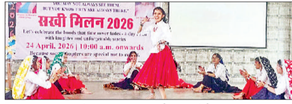
बहादुरगढ़। कार्यक्रम में सांस्कृतिक हरियाणवी प्रस्तुति देती छात्राएं।