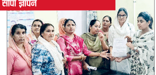
झज्जर। विरोध प्रदर्शन करते हुए आंगनबाड़ी वर्कर्स एवं हेल्पर, प्रशासनिक अधिकारी को ज्ञापन सौंपते हुए आंगनबाड़ी वर्कर्स एवं हेल्पर।

आंगनबाड़ी केंद्रों में राशन भी नहीं पहुंचा है, जबकि सरकार 9 अप्रैल से 23 अप्रैल तक पोषण पखवाड़ा चला रही है। ऐसे में बिना राशन के पोषण अभियान चलाना केवल कागजी कार्यवाई बनकर रह गया है। आंगनबाड़ी कार्यकर्ताओं का कहना है कि विभाग द्वारा ऑनलाइन कार्रवाई दिखाने के लिए कर्मचारियों पर दबाव बनाकर